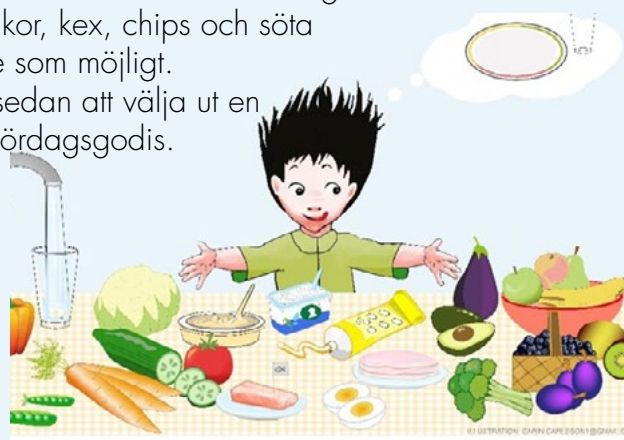
ILLUSTRATION: CARIN CARLSSON/RITBOLAGET

För att växa och må bra behöver vi olika sorters mat. Det är bra att vänta med att ge barnet godis, kakor, kex, chips och söta drycker så länge som möjligt. En bra vana är sedan att välja ut en dag i veckan – lördagsgodis.