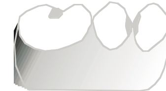
يعود سبب تسوس الأسنان إلى البكتيريا والسكر

يعود سبب تسوس الأسنان إلى البكتيريا والسكر. توجد البكتيريا في الفم دائما وتلتصق هذه بالأسنان بسهولة. تسمى طبقة البكتيريا هذه بنخر الأسنان. في كل مرة يكون فيها للبكتيريا اتصال بالسكر يتكون حامض يسبب اهتراء الأسنان، مما يصيب المرء بتسوس الأسنان.